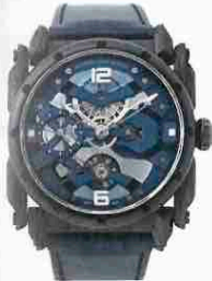
ADN スピリット ブルー-DLC

フォージドカーボンのフレームがケースを浮かすように支える。限定28本。手巻き。径46mm。SSケース。カーフストラップ。3気圧防水。395万円。7月発売予定。