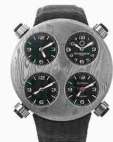
刀剣マニアも魅了する アイコン ダマスカス

刀剣や高級包丁で使われるダマスカス鋼をケースに採用。自動巻き。径49mm。ダマスカス鋼+チタンケース。アリゲーターストラップ。5気圧防水。予価120万円。今秋発売予定。