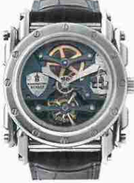
アンドロジーン フルブルー

ブリッジをつり下げるように設置し、トゥールビヨンが宙に浮く。手巻き。径43mm。SSケース。アリゲーターストラップ。3気圧防水。参考価格687万円。受注生産。