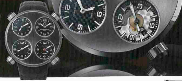
1本ずつ異なる質感 アイコン ネロフェーモ

初期にあったグリーンが復活。挑発的な色合いから、モデル名は伊語で毒。自動巻き。径49mm。チタンケース。アリゲーターストラップ。5気圧防水。予価100万円。今秋発売予定。