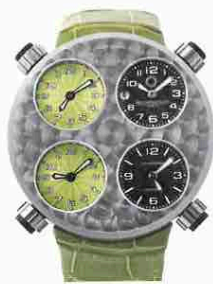
ほのかに毒づく新緑色 アイコン ヴェレーノ

刀剣や高級包丁で使われるダマスカス鋼をケースに採用。自動巻き。径49mm。ダマスカス鋼+チタンケース。アリゲーターストラップ。5気圧防水。予価120万円。今秋発売予定。