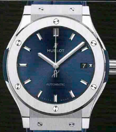
HUBLOT CLASSIC FUSION TITANIUM BLUE

エンジンパーツをイメージしたケースは、4つの時刻表示が収まるほど大型。しかしチタン素材を使っているため、着用感は良好。ケース前面にはヘルラージュ模様が施される。自動巻き、Tiケース、ケース径49mm、¥880,000/メカニケ・ヴェローチ(ビッグローブ)