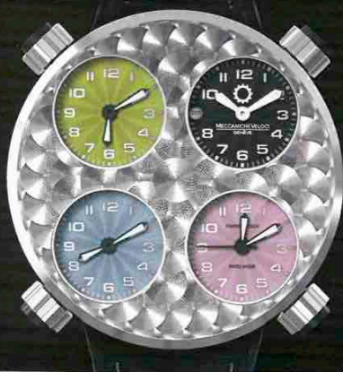
MECCANICHE VELOCI ICON