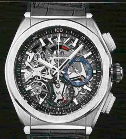
ZENITH DEFY EL PRIMERO 21

「ウブロ」流のクラシックスタイルを追求している人気モデルがベース。かなり加工が難しいチタン素材に対してポリッシュ仕上げとヘアライン仕上げを使い分けており、立体感のある美しいケースが完成した。自動巻き、Tiケース、ケース径45mm、¥820,000/ウブロ